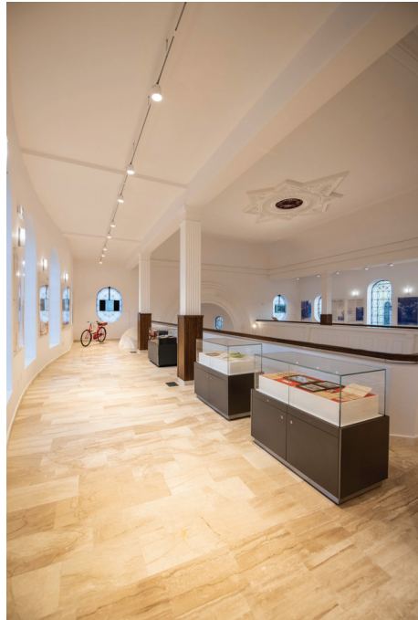
Fig. 6 – În amintirea Évei Heyman.